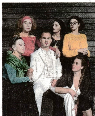
La troupe du Farrago sera sur scène, samedi.

Samedi 11 mai à 20 h, la pièce d'Éric-Emmanuel Schmitt sera jouée par le Théâtre Farrago. « Dans la campagne normande, au château de Valognes, cinq femmes, anciennes amantes de Don Juan, veulent instruire son procès, pour le forcer à épouser la dernière demoiselle qu'il a séduite. Et Don Juan accepte... » Cette pièce, la première écrite par Éric-Emmanuel Schmitt, en 1989, est une réécriture du mythe de Don Juan. L'adaptation du Théâtre Farrago est drôle et dramatique. Elle livre une réflexion sur le personnage de Don Juan qui, d'après Schmitt, « ne vit que par la sexualité, sans l'avoir comprise, et souhaiterait que quelqu'un l'arrête dans cette quête sans fin du désir ».