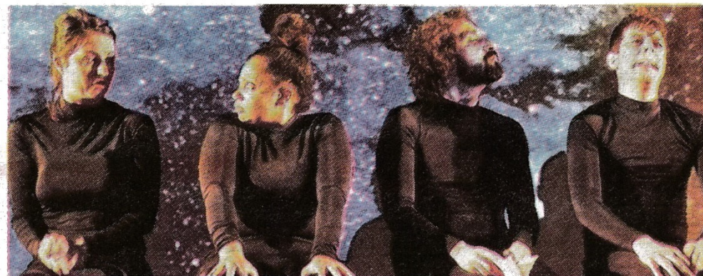
Les acteurs de la Compagnie Six pieds sur terre.

Leïla affirme que jamais elle-même ne pourrait être manipulée. Sarah relève le défi dans l'anonymat d'Internet. Leïla plonge sans questionnement dans la cause imaginée par sa sœur (une association armée pour la défense des animaux). En parallèle et incarnées par les comédiens, on suit les émotions primaires de Leïla : la colère, la tristesse, la peur, la joie et, enfin, la réconciliation afin de reculer face à la violence dans laquelle elle s'engageait.